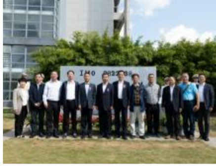
“育锋”轮船名雕塑揭幕仪式