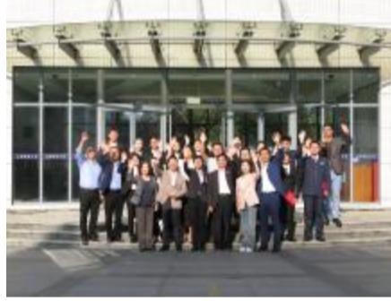
交通运输学院华展奖学金颁奖仪式