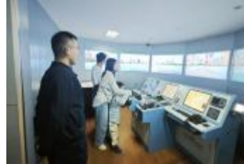
航海模拟器实验室参观