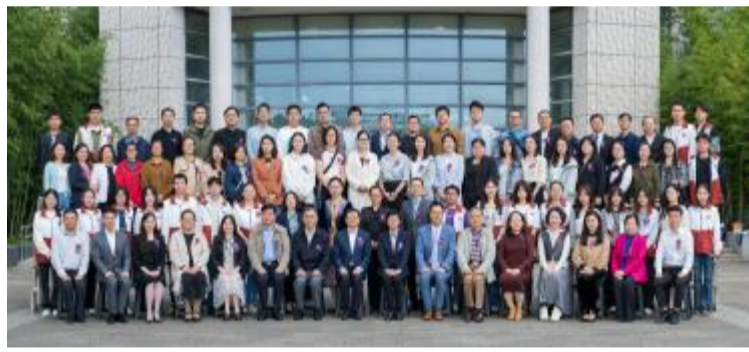
马克思主义学院校友会成立

在大会结束之际,全体校友共同唱响了上海海事大学校歌《破浪向前》,一起团结奋进、破浪向前、共创未来!