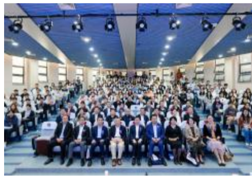
经济管理学院MBA、EMBA校友会成立、校友帆船俱乐部成立