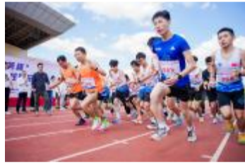
公益慈善乐跑活动