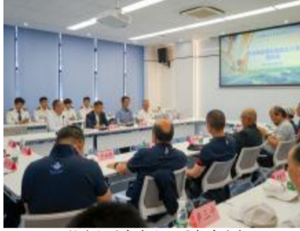
校友俱乐部成立六周年座谈会